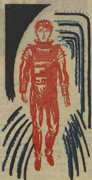
Рис. Н. БИСТН